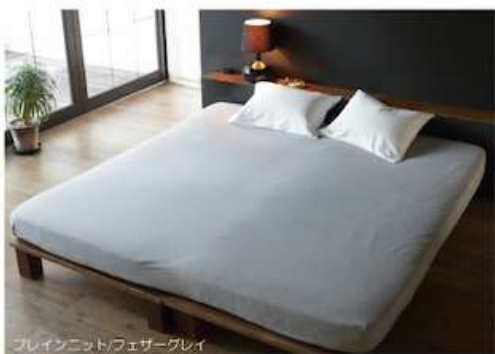
フレイニット/フェザーグレイ