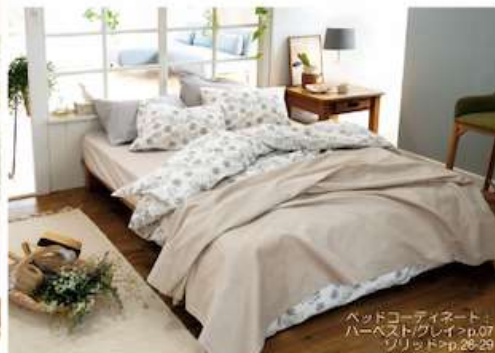
80コマ使用ワッフル織