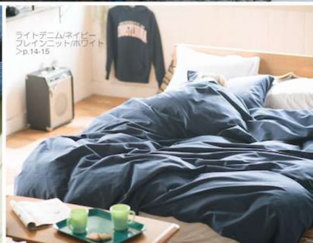
ライトデニム/ネイビー フレイミング/ホワイト >p.14-15