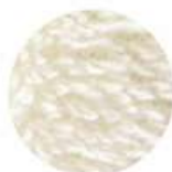
Fab the Home エアリーパイル 毛足約3mm

毛足(パイル)の長さは 一般的なシンカーパイルよりも Fab the Homeのエアリーパイルの方が2倍近く長くなっています。この長いパイルのおかげで 見た目も 風合いも ふんわり やわらかになり いつものタオルに近い肌ざわりに仕上がっています。