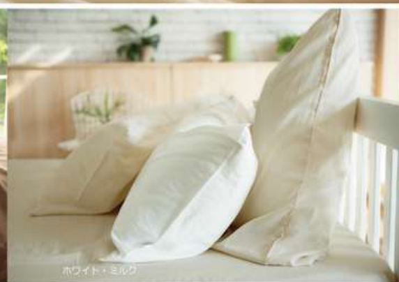
ホワイト・ミルク