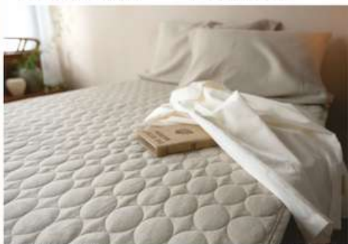
ヨーロッパ産リネン類 (90%) ナチュラル