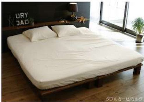
ダブルガーゼ/ミルク

Double gauze ダブルガーゼ 品質：綿100% ・220cm生地使用、どのサイズも接ぎ目がありません。 ・ベッドリネン> p.24-25 ・レディスパジャマ> p.20-21