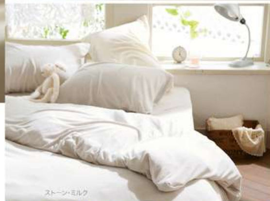
ストーン・ミルク