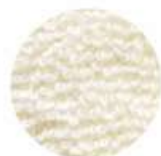
一般的な シンカーパイル 毛足約1.5mm