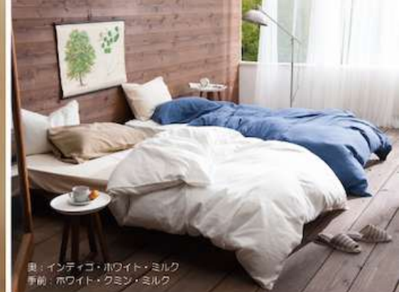
奥: インディゴ・ホワイト・ミルク 手前: ホワイト・クミン・ミルク