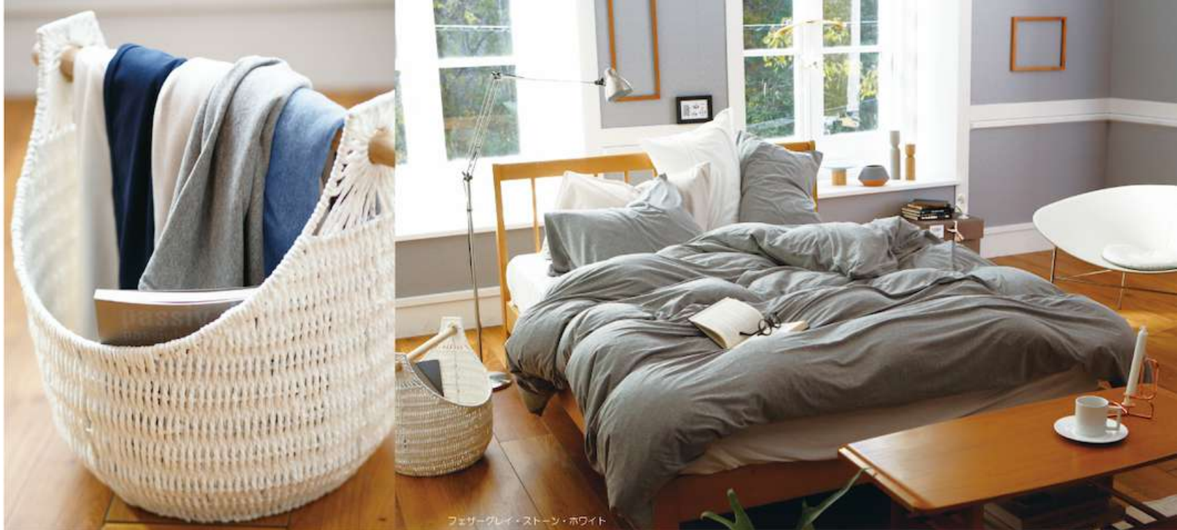
フェザーグレイ・ストーン・ホワイト

・215cm巾生地使用、どのサイズも巾揃えしていません。 ・ベッドシーツ> p.57