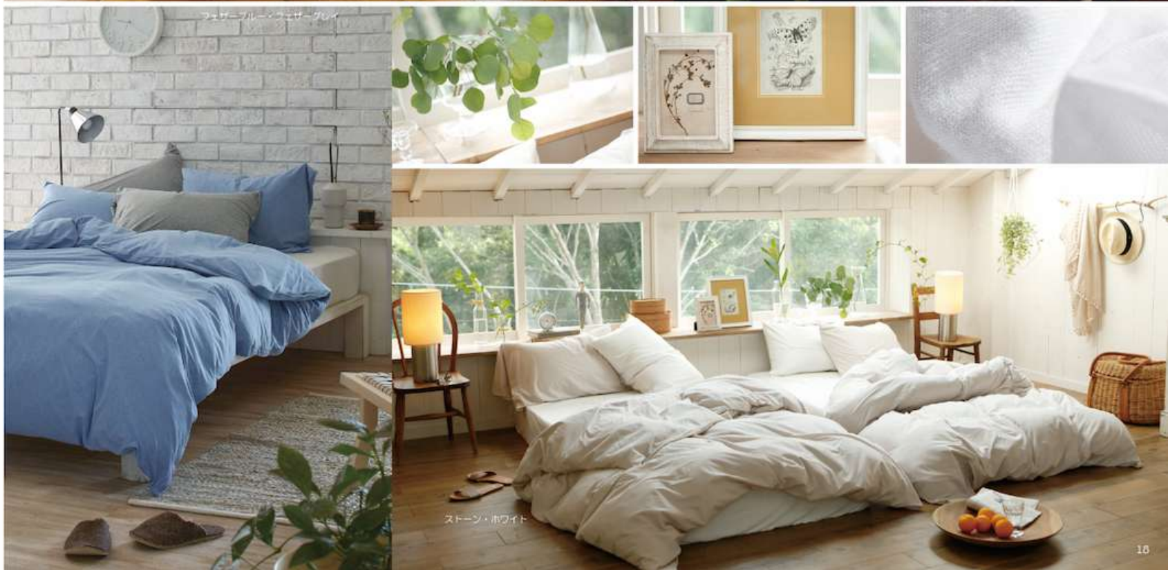
フェザーブルー・フェザーグレイ