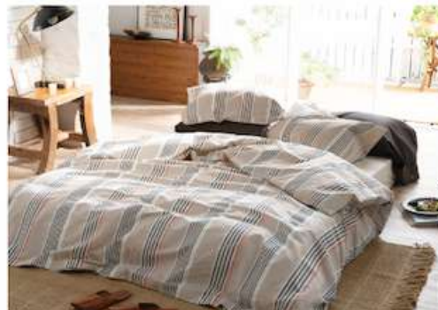
ヘリンボーン織り