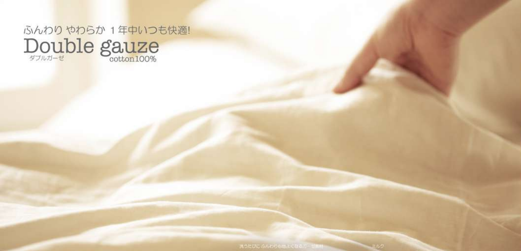
洗うたびに ふんわり心地よくなるガーゼ素材