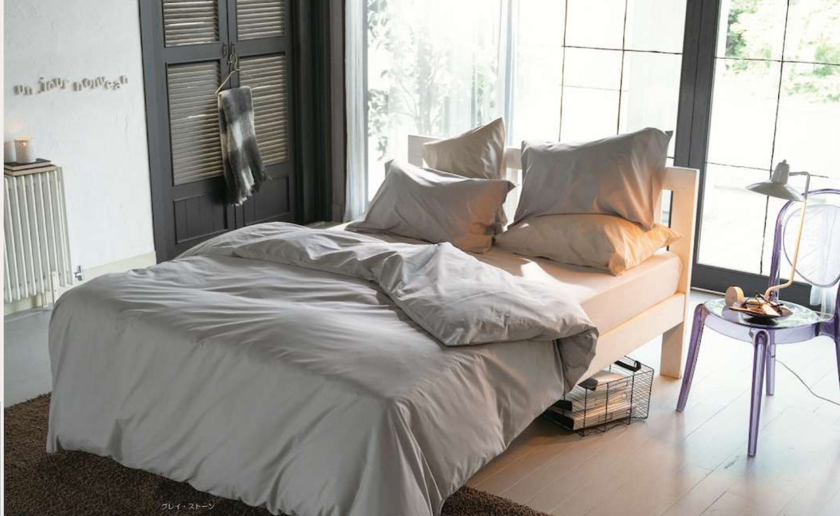
プレイ・ストーン

40番コーマ糸(糸を紡ぐ行程でコーミングし綿の良質な部分だけで仕上げた糸)を使用したのがなめらかで心地よい肌ざわりになりました。静電気も起きにくくお肌にやさしいファブリックです。