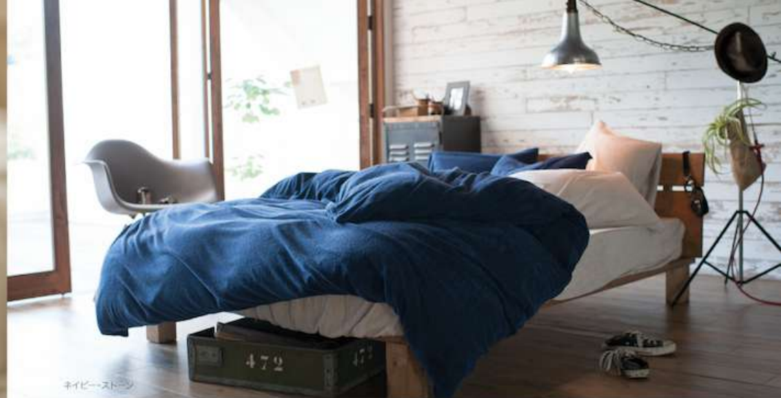
ネイビー・ストーン

毛足(パイル)の長さは 一般的なシンカーパイルよりも Fab the Homeのエアリーパイルの方が2倍近く長くなっています。この長いパイルのおかげで 見た目も 風合いも ふんわり やわらかになり いつものタオルに近い肌ざわりに仕上がっています。