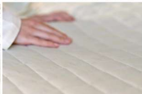
コットンニット (130) ストーン

品質: 表地=綿100% 裏地=ポリエステル80%・綿20% 詰めもの=ポリエステル100% ・ベッドリネン> p.14-15 ・大きなサイズのシート> p.42