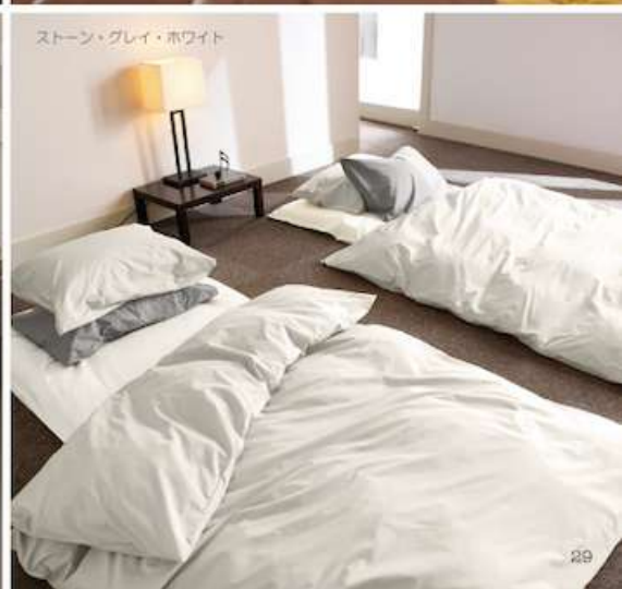
ストーン・グレイ・ホワイト