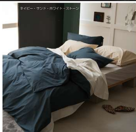
ネイビー・サンド・ホワイト・ストーン