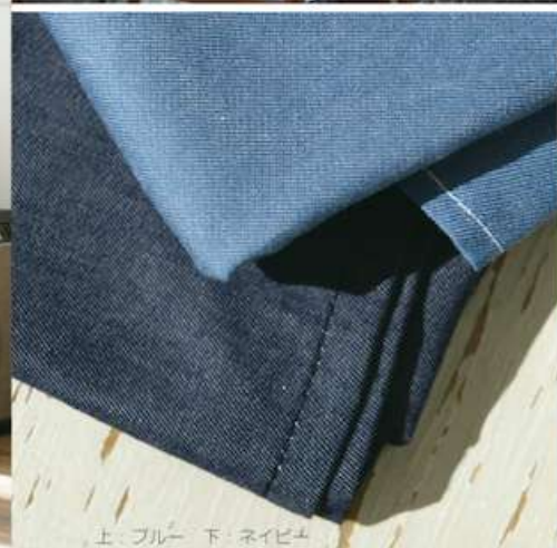
上・ブルー 下・ネイビー