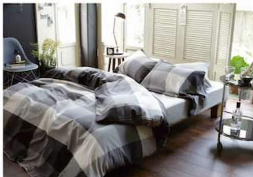
ヘリンボーン縞り