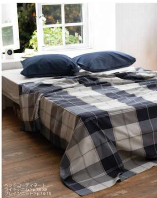
ベッドコーディネート ライトデニム p.38-39 フレインニット p.14-15