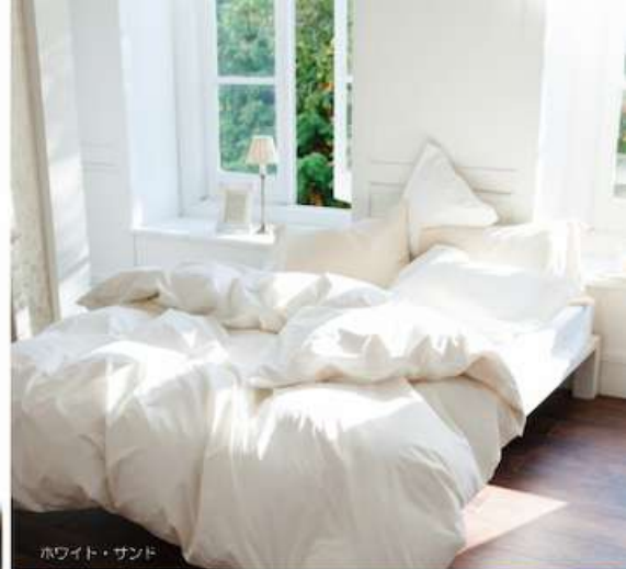
ホワイト・サンド