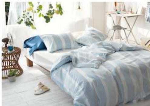
オックスフォード織り