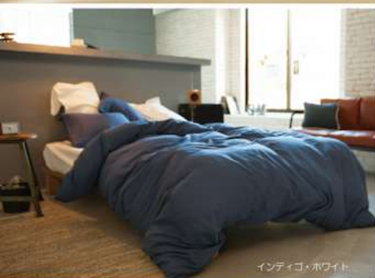
インディゴ・ホワイト