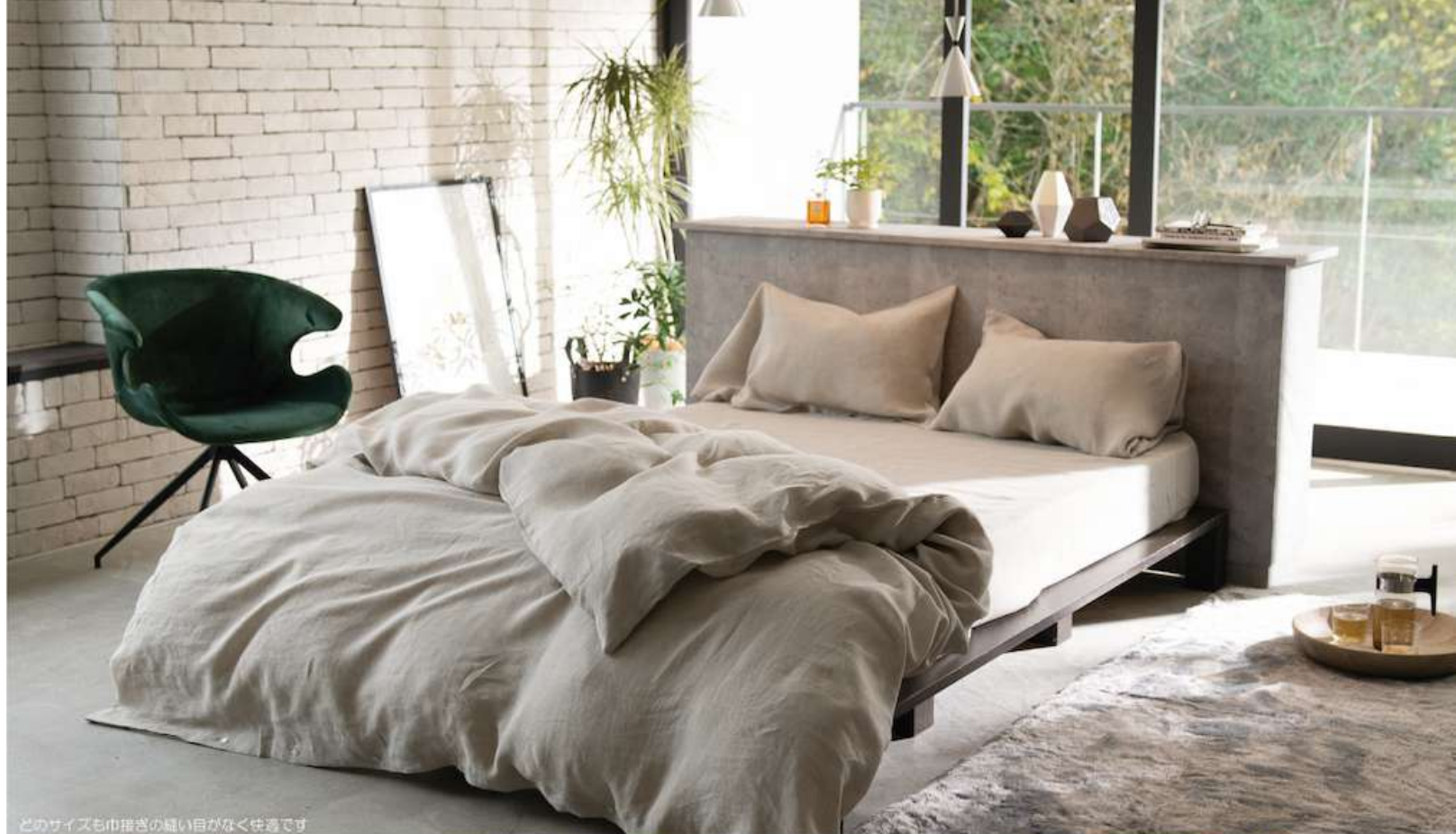
どのサイズも巾着さの縫い目がなく仕立てず

引裂強さデータ | 綿100%の200本ブロード(FH811ソリッド)に比べ約6倍の丈夫さです。