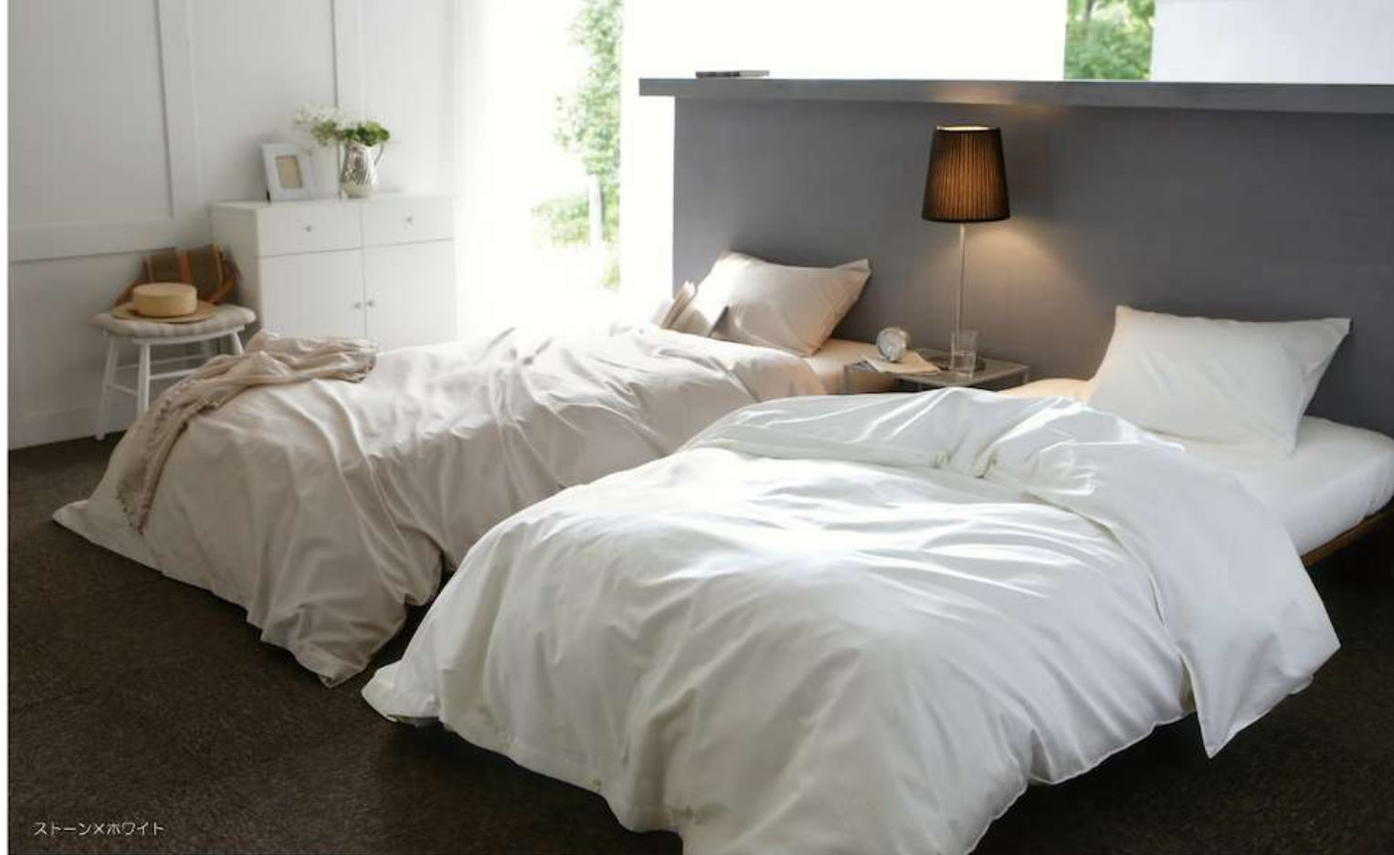
ストーン×ホホワイト