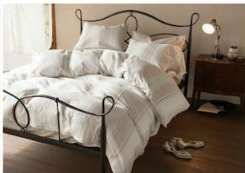
ツイル・ワッフル織り