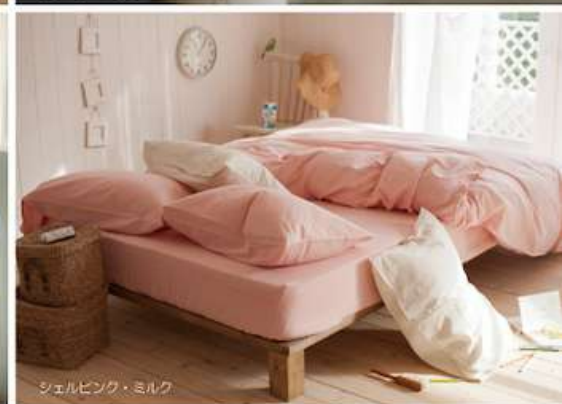
シェルピンク・ミルク