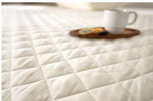
ダブルガーゼ (910) ミルク

品質: 表地=綿100% 裏地=ポリエステル80%・綿20% 詰めもの=ポリエステル100% ・ベッドリネン> p.24-25 ・大きなサイズのシート> p.44