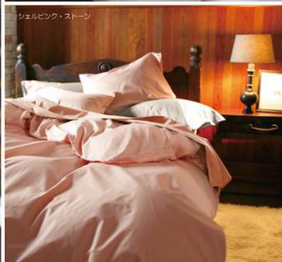
シェルピンク・ストーン