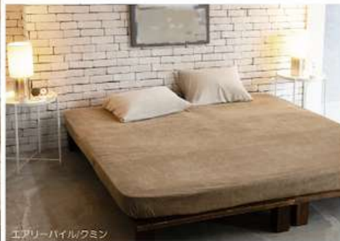
エアリーパイル/クミン

Airy pile エアリーパイル 品質：パイル=綿100% グランドーポリエステル100% ・215cm生地使用、どのサイズも接ぎ目がありません。 ・ベッドリネン> p.40-41