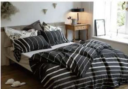
ヘリンボーン縞り