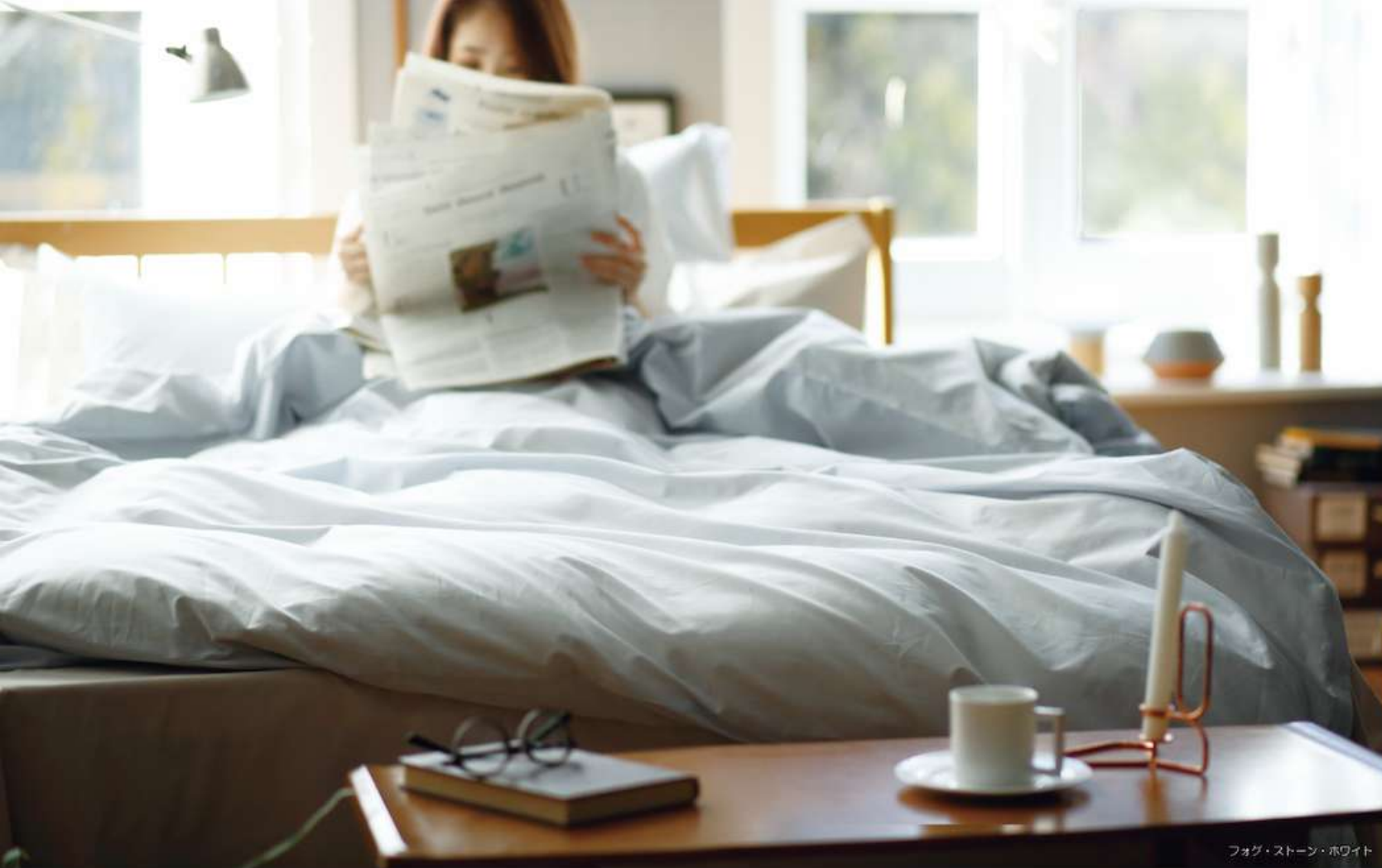
フォグ・ストーン・ホワイト