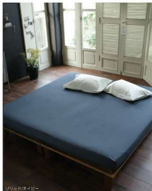
ソリッド/ネイビー