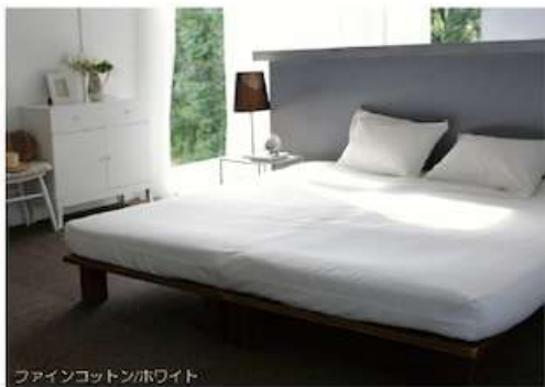
ファインコットン/ホワイト

Fine cotton egyptian ファインコットン エジプシャン 品質：綿100% ・225cm生地使用、どのサイズも接ぎ目がありません。 ・ベッドリネン> p.30-33